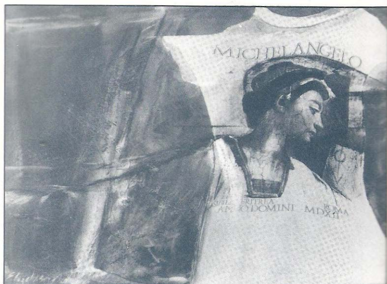
Acrílico s/ tela e colagem - 1994 33x64

Abertura: 10 de outubro de 1995, às 20:00 hs